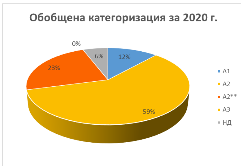
Фиг. 3 Обобщена категоризация на повърхностни води, предназначени за ПБВ на територията на ДРБУ за 2020 г. в проценти от общия брой

На територията на ДРБУ няма пунктове, оценени в категория А3 за 2020 г.