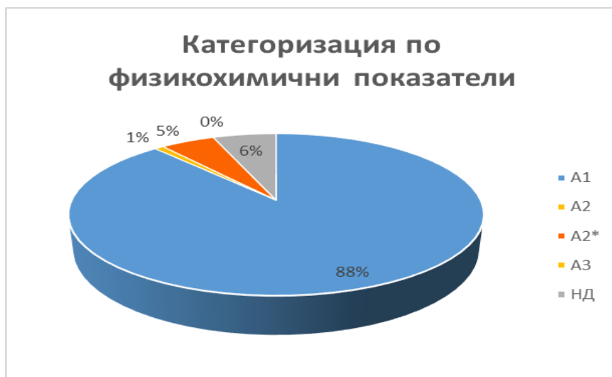
Фиг. 1 Категоризация по ФХП за 2020 г. в проценти от общия брой

7 броя водоизточника, не са категоризирани по ФХП, тъй като за тях липсват актуални данни за 2020 г. Пунктовете не са били включени в националната програма за контролен мониторинг на повърхностни води, предназначени за ПБВ за 2020 г. и за тях не са получени данни от собствен мониторинг.