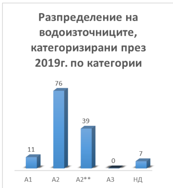
Фиг. 4 Категоризация 2019 г.

На фигури 4 и 5 са представени категоризираните водоизточници за 2019 и 2020 г. От тях е видно, че броят на водоизточниците оценени с категория А1 и А2 се запазва почти същият, а броят на водоизточниците оценени с категория А2** е намалял. Броят на водоизточниците, за които не са налични резултати от мониторинг също се е запазил.