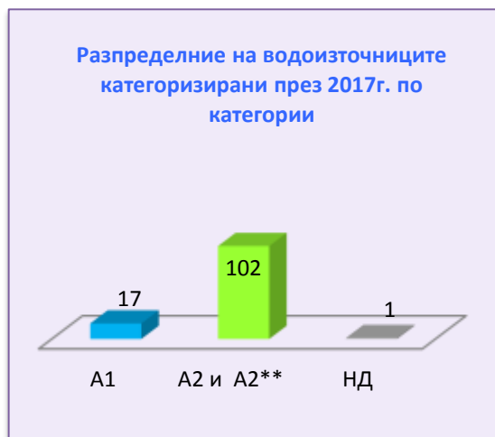
Фиг.4 Категоризация 2017г.

на А2 и А2** се е увеличил. Броят на водоизточниците, за които не са налични резултати от мониторинг се запазва минимален.