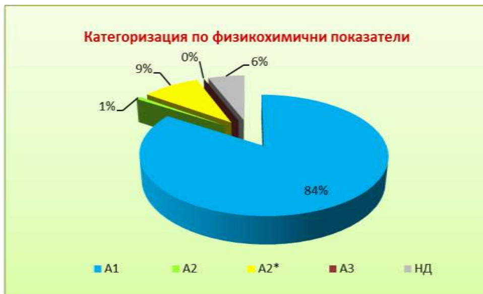
Фиг. 1 Категоризация по ФХП за 2018 г. в проценти от общия брой

За 7 водоизточника не са получени данни от мониторинг на ФХП и същите не са категоризирани по ФХП.