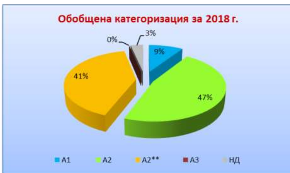
Фиг. 3 Обобщена категоризация на повърхностни води, предназначени за ПБВ на територията на ДРБУ за 2018 г. в проценти от общия брой

На територията на ДРБУ няма пунктове, оценени в категория А3 за 2018 г.