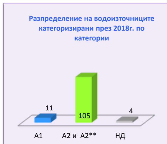
Фиг.5 Категоризация 2018г.

Причините, които най-често водят до понижаване на категорията на повърхностните води предназначени за ПБВ са: